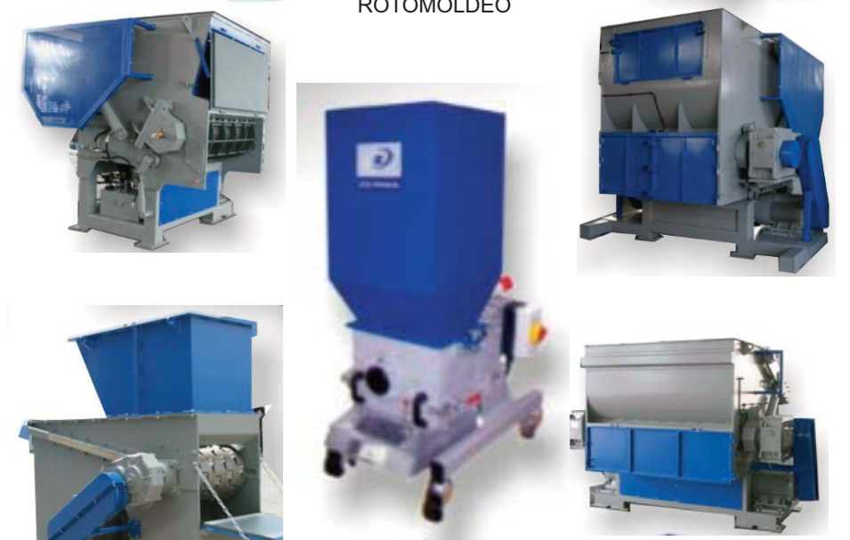
MOLINOS Y TRITURADORES

MAYOR INFORMACION: ROBERTO O. RODOFELI y Cía. S.R.L. Nueva planta y oficinas: Diag. 76 N° 1655 (ex J. M. Campos 1370) 1651 - San Andrés - Provincia de Buenos Aires - Argentina Tel.: (54-11) 4752-8329/2665 - FAX: 4755 0574 E-mail: of.comercial@rodofeli.com.ar Web: www.rodofeli.com.ar/