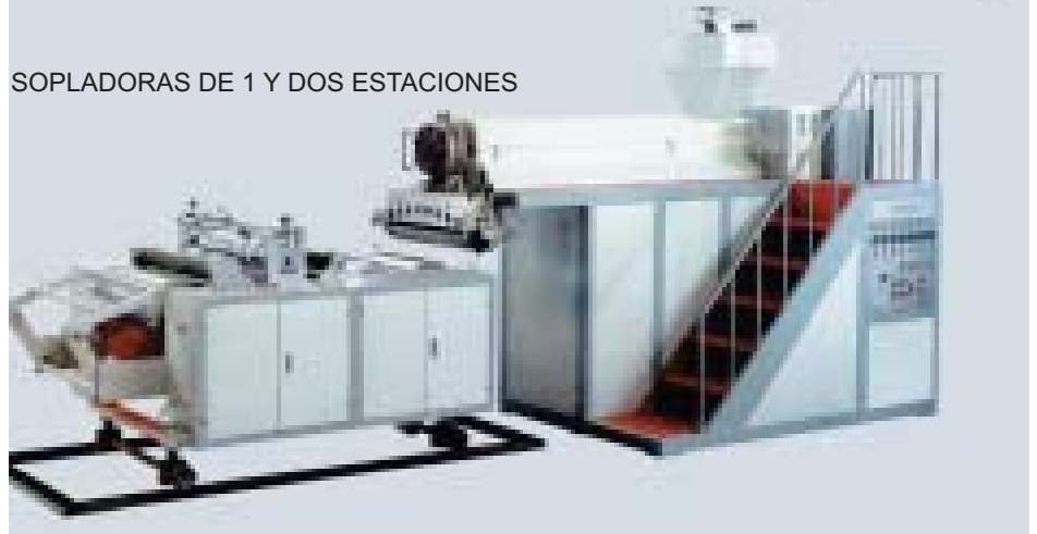
SOPLADORAS DE 1 Y DOS ESTACIONES