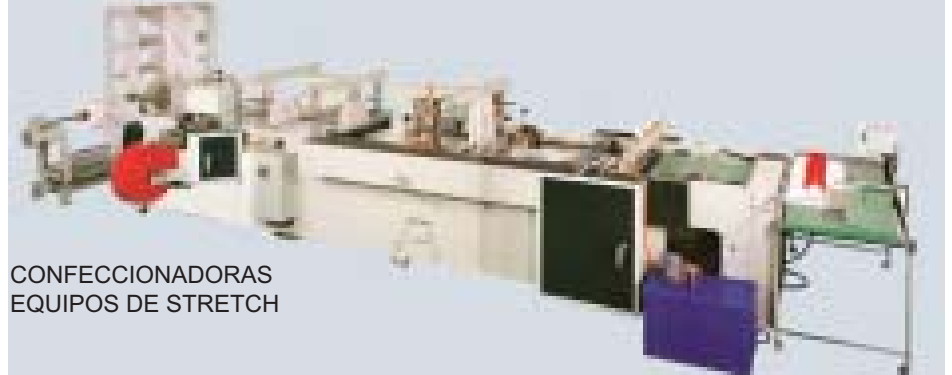
CONFECCIONADORAS EQUIPOS DE STRETCH